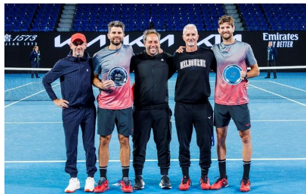
Finalista Australian Open e US Open