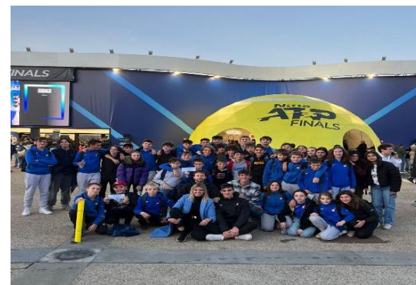
I nostri ragazzi