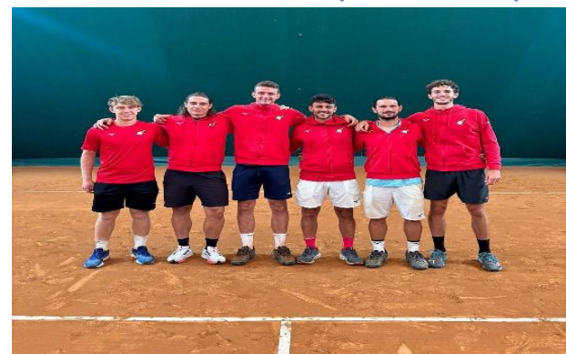
La nostra squadra promossa in B2