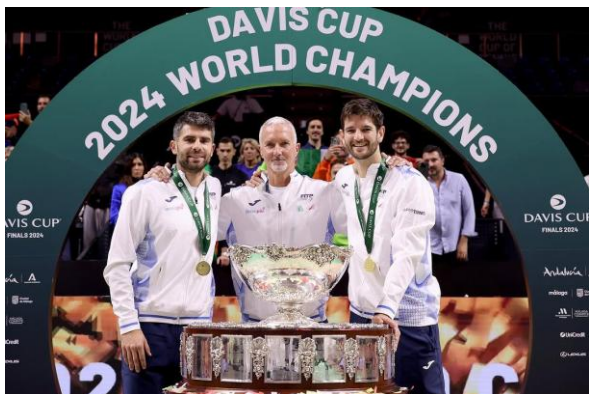
Andrea Vavassori e la Davis Cup