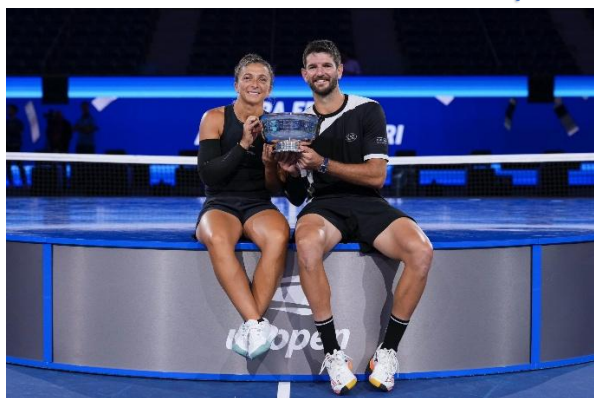
Vincitori US Open doppio misto 2025